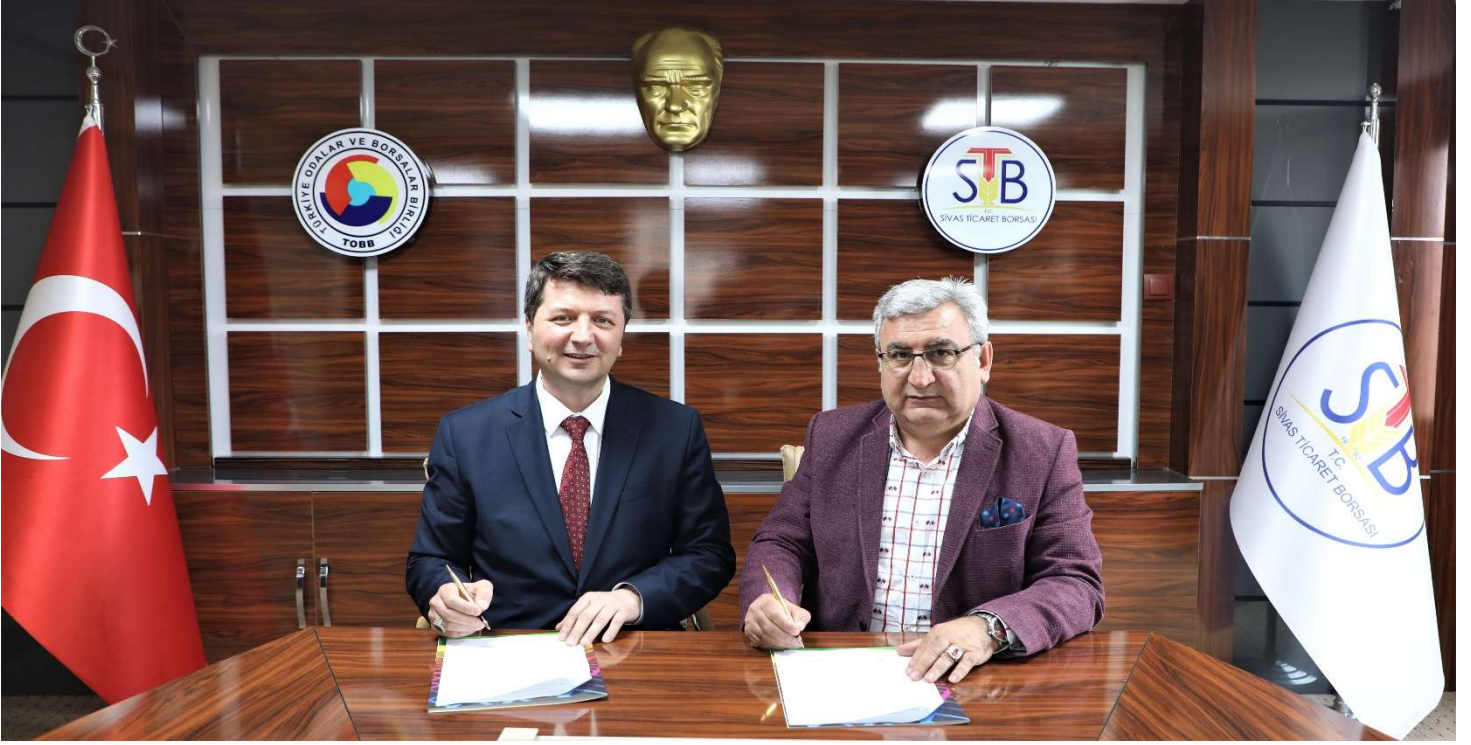
KAYSERİ LIDAŞ İLE BORSAMIZ YETKİLİ SINIDLANDIRICI ŞİRKETİ ARASINDA HİZMET SÖZLEŞMESİ İMZALANDI.