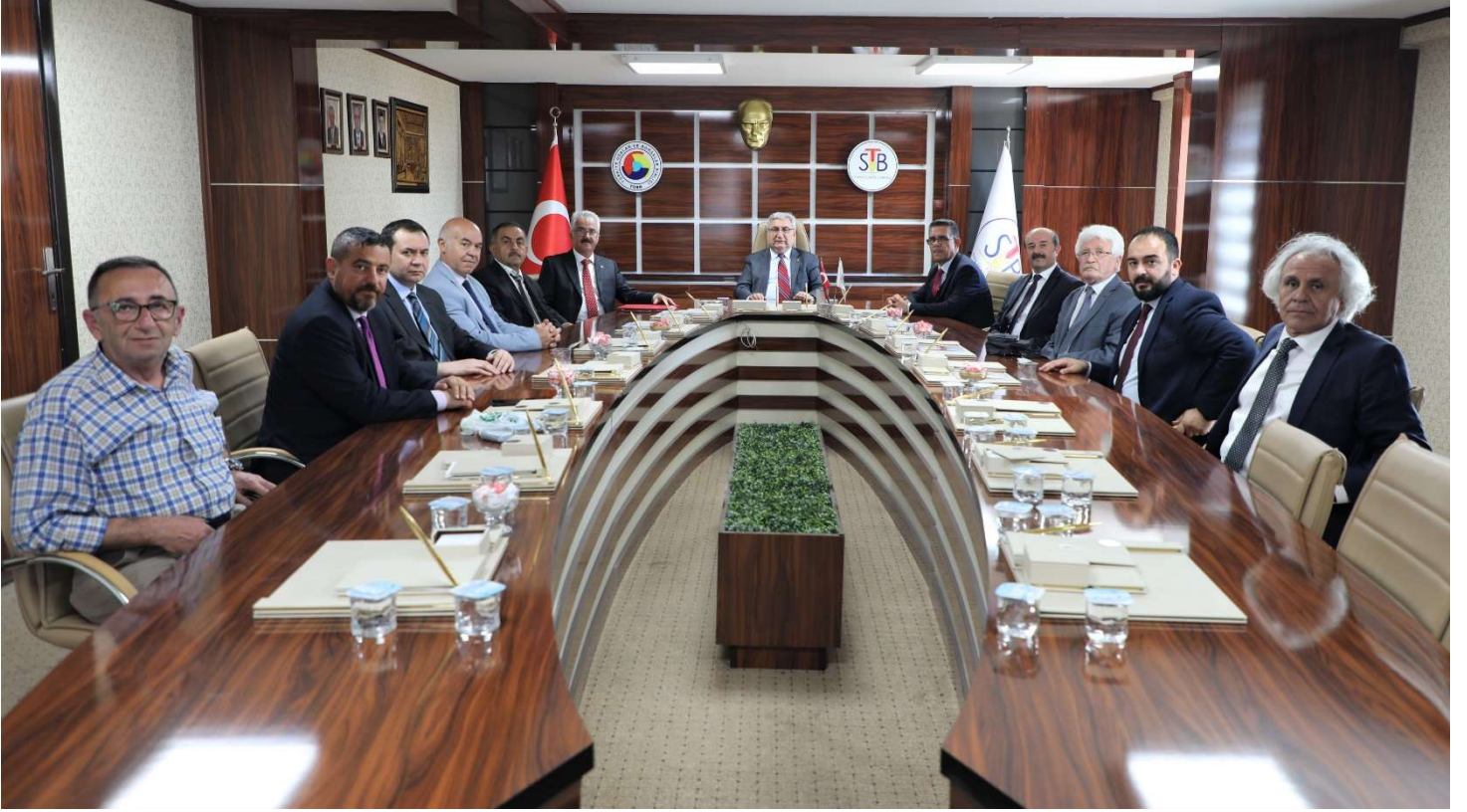
ANKARA SİVASLI DERNEKLER FEDERASYONU ASİDEF'TEN BORSAMIZA ZİYARET